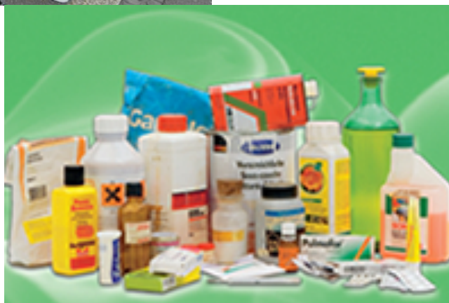
Sammelstelle für Sonderabfälle